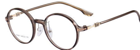
C12 Coffee 冷茶色