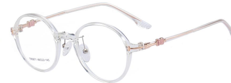
C22 Transparent 透明白玫