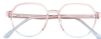
C6 Pink/Blue 上粉下蓝