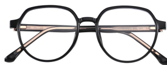
C1 Black 黑