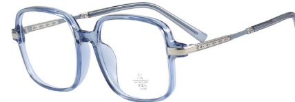
C6 Blue 蓝