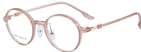
C15 Milky Coffee 奶茶