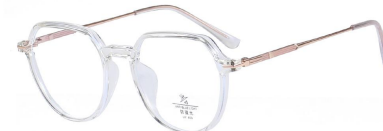
C22 Transparent/Rose Gold 透明白玫