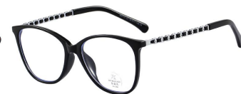
C2 Black/Silvery 黑银