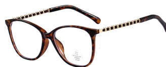
C3 Deml 豆花