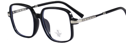
C2 Black/Silvery 黑银