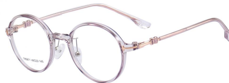
C13 Purple 紫