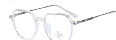
C20 Transparent/Silvery 透明白银