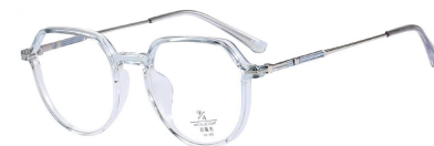
C14 Gradually Blue 渐进蓝