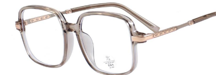
C7 Coffee 咖