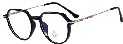
C11 Black/Gold 黑金