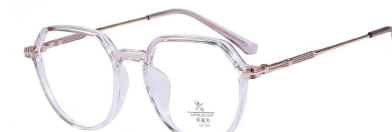
C13 Gradually Purple 渐进紫