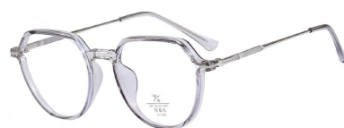
C6 Grey 灰