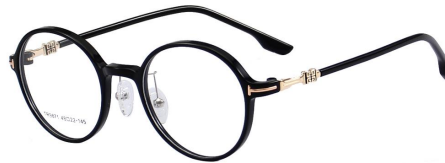
C11 Black/Gold 黑金