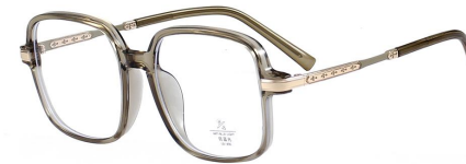
C8 Green 军绿