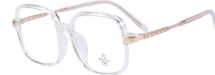
C3 Transparent/Rose Gold 透明白玫