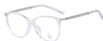
C7 Transparent/Silvery 透明白银