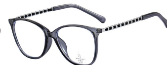
C4 Dark Grey 深灰