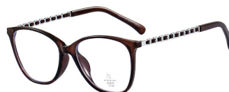
C6 Brown 深茶