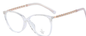
C5 Transparent/Rose Gold 透明白玫