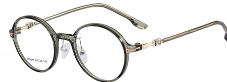
C18 Green 绿