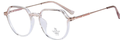
C15 Gradually Coffee 渐进咖