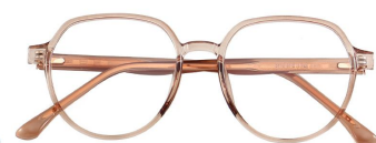
C7 Coffee 咖