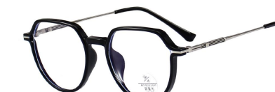
C10 Black/Silvery 黑银