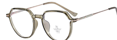
C8 Green 军绿