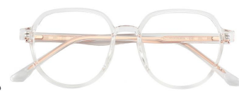
C2 Transparent 透明白