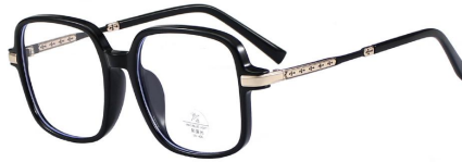
C1 Black/Gold 黑金