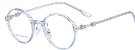
C14 Blue 蓝