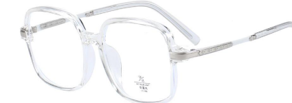
C5 Transparent/Silvery 透明白银