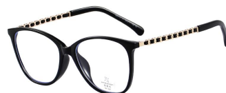
C1 Black/Gold 黑金