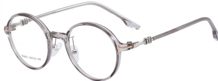
C6 Grey 灰