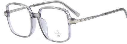
C4 Grey 灰